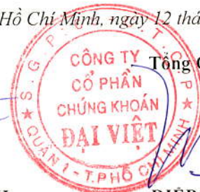
DIỆP TRÍ MINH