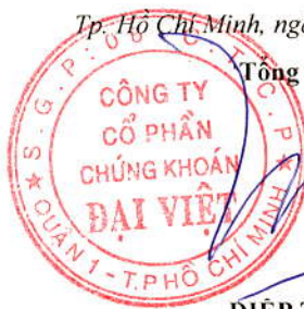
DIỆP TRÍ MINH